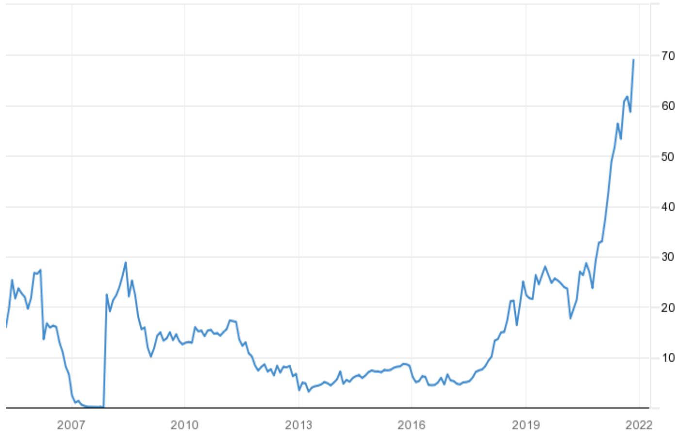
EU Carbon Permits